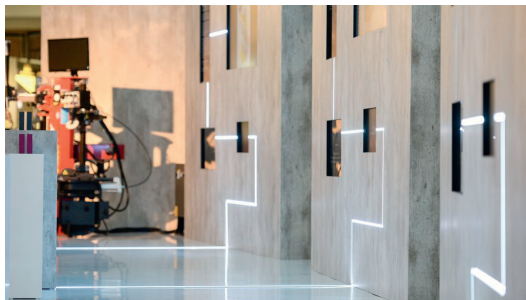
Installationsbeispiel: Flächenbündig in eine Oberfläche eingelassen