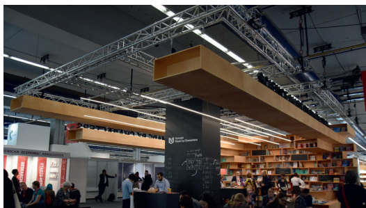
Installationsbeispiel: Abhängung an einem Traversengerüst